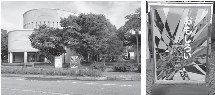
図4 おもしろい大学（富山市五福，2019.6.17 稿者撮影）

ということについては、新学長の強い意気込みは感じられるが、一方で近年の学外からの様々な「圧力」 4) に曝される我々には素直に「おもしろい」と感じることはできない 5) 。