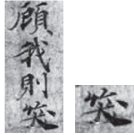
図7 唐代敦煌文献(S.10毛詩)に見える「笑」 (8世紀中期頃書写, IDP 画像に拠る)

このポスターの作制者が、このような漢字字体史まで理解して「大」字に「笑」字を重ね合わせてデザインしたとするならば、その学識の深さは驚嘆に値する。しかしもしそうだとするならば、このポスターの「大学」(笑学)からは、作成者や齋藤新学長の意図とは全く無関係に、「笑」に含まれるもう一方の意味「嘲笑(あざわらう)」 8) に誤解される(曲解される)危惧を感じてしまう。そうでなくても近年おもしろくないことが多い我々にとっては、「おもしろい大学」は皮肉に聞こえてしまって仕方がない。図7に掲げた敦煌文献S.10毛詩の「顧我則笑」に続く注釈(割注)には「笑侮(之也)…是无敬心之甚也」とある 9) 。