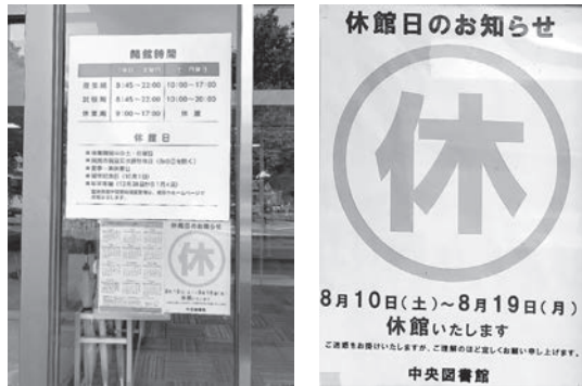
図 8 富山大学中央図書館玄関貼紙 (富山市五福, 2019.8.9)

高等教育・研究機関の心臓部とも言える図書館の長期休館は、稿者のような人文科学の研究者にとっては研究休止を意味するだけでなく、夏休みに集中的に勉強しようとする大学生や夏休みの課題を図書館で仕上げようとする市民（小中高生やその親）にとっても重大な障害になる。この貼紙には休館の理由は記されず、いわば図書館（図書館を管理する大学）の一方的都合を表明したものである。利用者に対するお詫びの気持ちは貼紙下方に小さく「ご迷惑をお掛けいたしますが、ご理解のほど宜しくお願い申し上げます。」と記されているが、この時期、商店街や観光地は書入れ時で（もちろん金融機関も休まず営業している）、そのノリで来館した利用者にとっては「迷惑」な話だし「理解」してもらえないかもしれない。もっと危惧されるのは、日本国内の高等教育・研究機関がのんびりと長期休業している間も世界の研究は瞬時も停まることなく活動していることである。例えば悪いが、気象観測衛星やミサイル防衛システムに夏季休暇が無いのと同じである。普段あまり図書館を利用されない研究者は、学内の研究室やネットワークは普段通り利用できるので図書館の休館は問題無いと思うかもしれない。しかし「一斉休業」の理由の一つが「省エネルギーの一層の推進」である以上、これは研究室・実験室も含めて電気（エアコン、照明、電子機器、実験装置）を使うなというに等しい内容であることを理解すべきである。富山大学の理念「国際水準の教育及び研究」（全文は富山大学HP「大学紹介」で閲覧できる）とこの長期休館（一斉休業）とは相容れない内容であると思う。