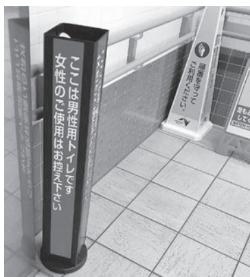
図2 北陸自動車道名立谷浜SA（下り線）の男性用トイレ看板（2019.3.22 稿者撮影）

観光地や行楽地、高速道路サービスエリアでのトイレは、女性にとっては深刻な問題である。女性用トイレの方が男性用に比べて圧倒的に混み合うからである。図2は北陸自動車道・名立谷浜SA（下り線）の男性用トイレ入口付近に設置されている看板で、「ここは男性用トイレです／女性のご使用はお控え下さい」と書かれている。