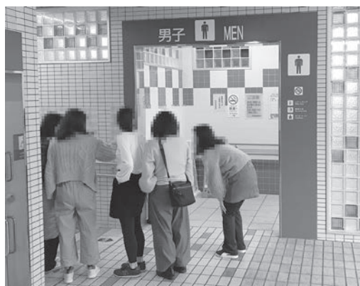
図3 北陸自動車道名立谷浜SA（下り線）の女性用トイレ前（2019.3.22 稿者撮影）