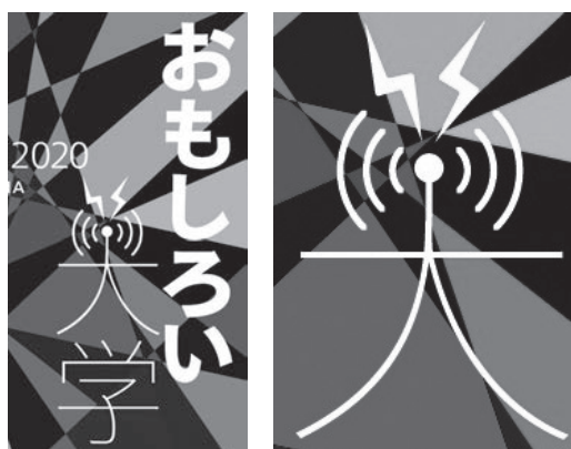
図5 おもしろい／大学（富山大学案内 2020 表紙の拡大）

このポスターが「おもしろい」のは新学長が発するメッセージではなく、「おもしろい」に続く「大学」の「大」字のデザインである。「大」の2画目起筆部分がヒトの頭部を表すかのように●になっていて、その●の左右に電波を発信するような弧が描かれ、さらに●の上には雷のような折れ線が二本突き出ている。政府が提唱する新たな社会「Society 5.0」 6) に対応する新しい学問の創出を目指そうとする新学長の意気込みを巧みに表現したものと理解される。