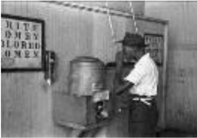
図 2-6 (62 ページ)