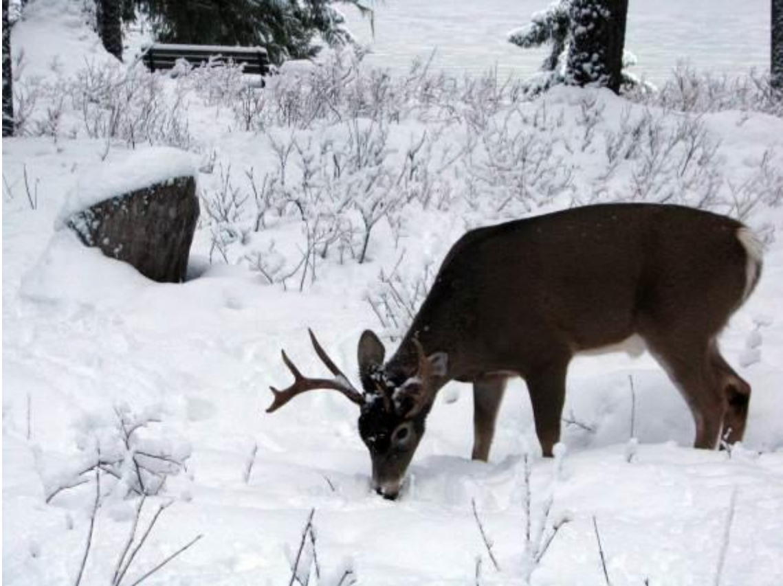
図 1-11 (39 ページ)