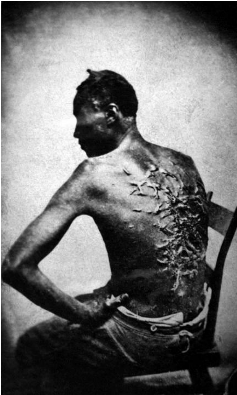
図 2-1 (45 ページ)