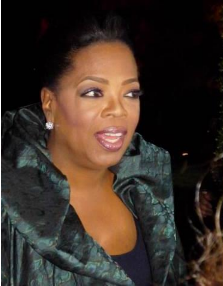
図 2-7 (71 ページ)