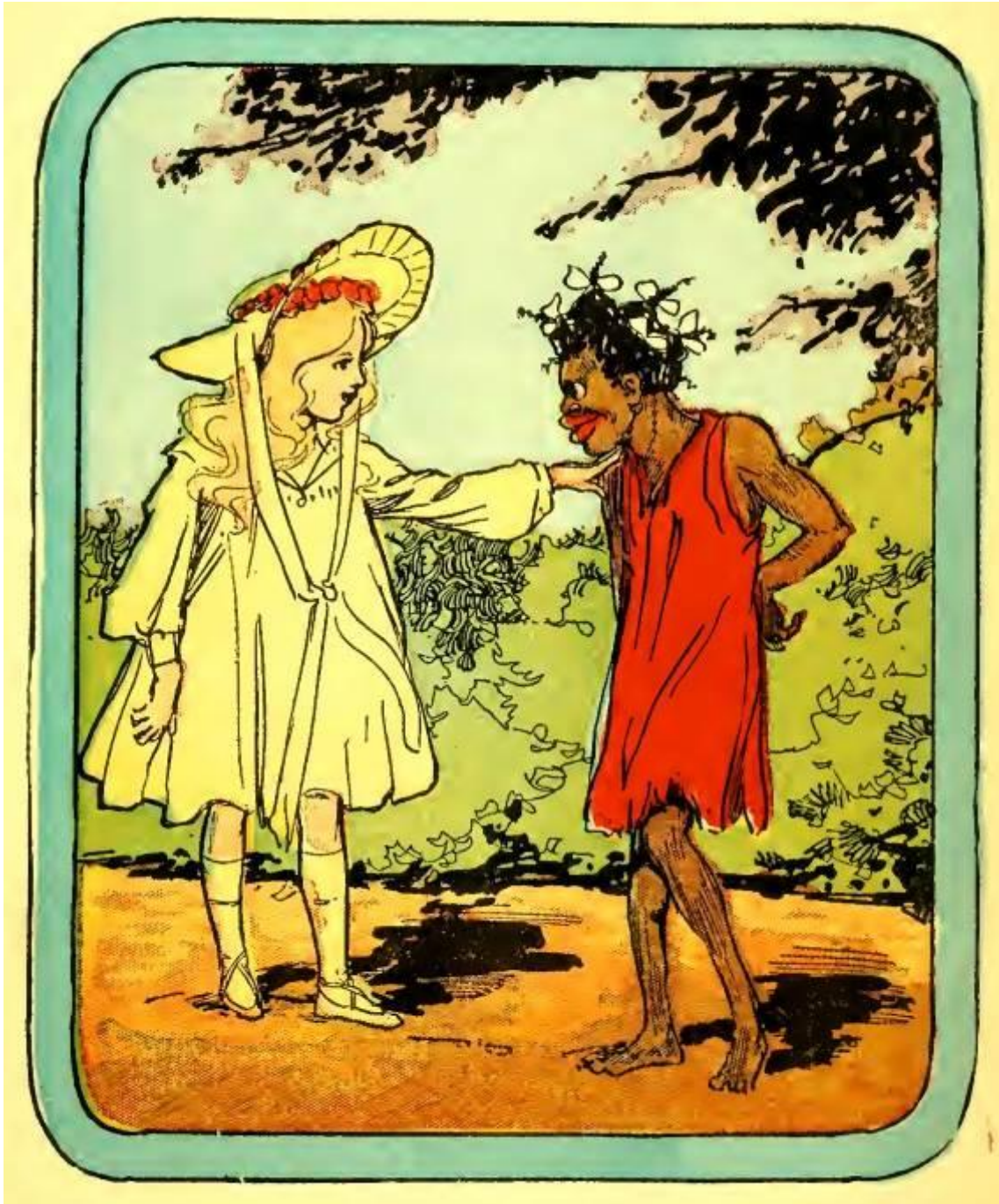
図 1-8 (29 ページ)