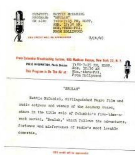
図 2-5 (60 ページ)