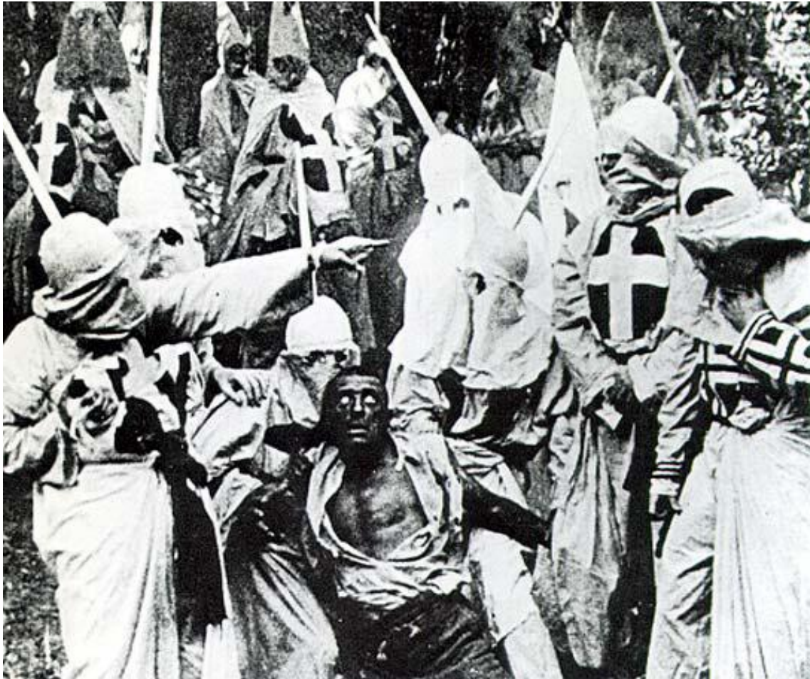
図 1-10 (38 ページ)