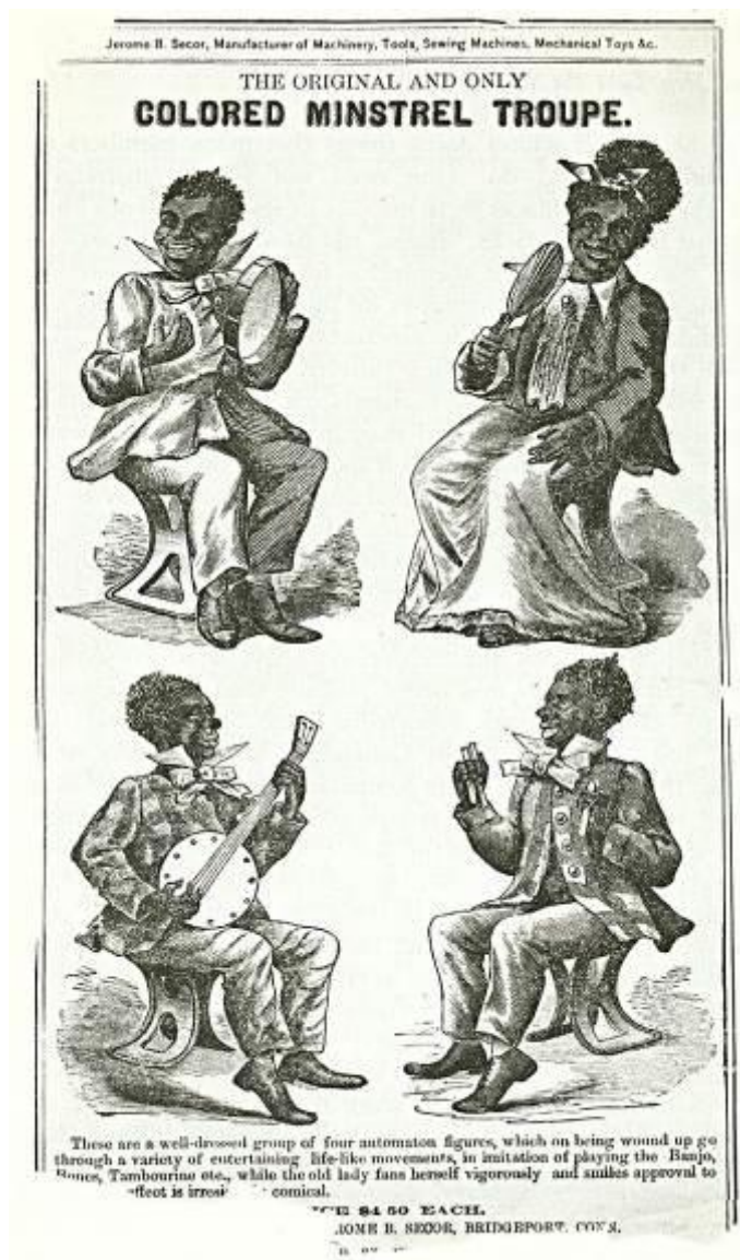
図 1-1 (11 ページ)