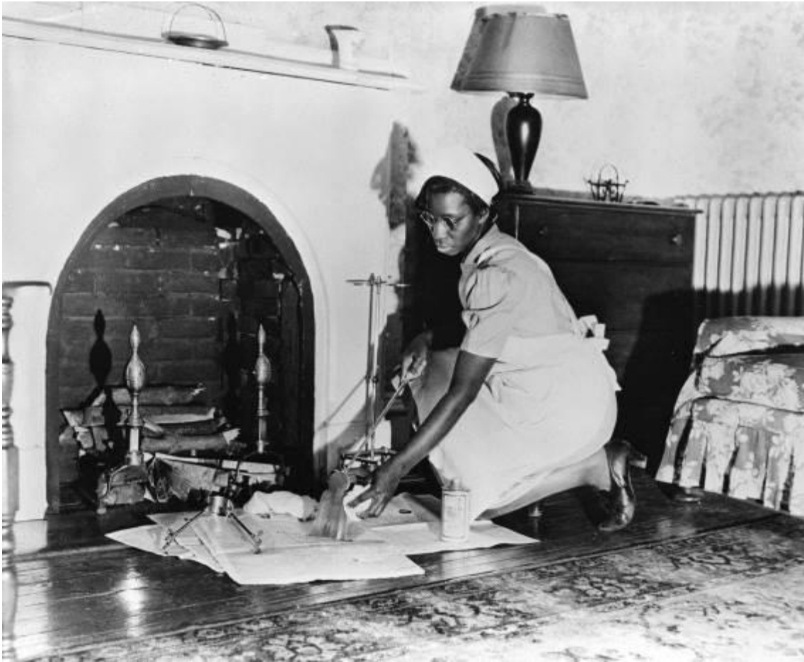
図 1-6 (22 ページ)