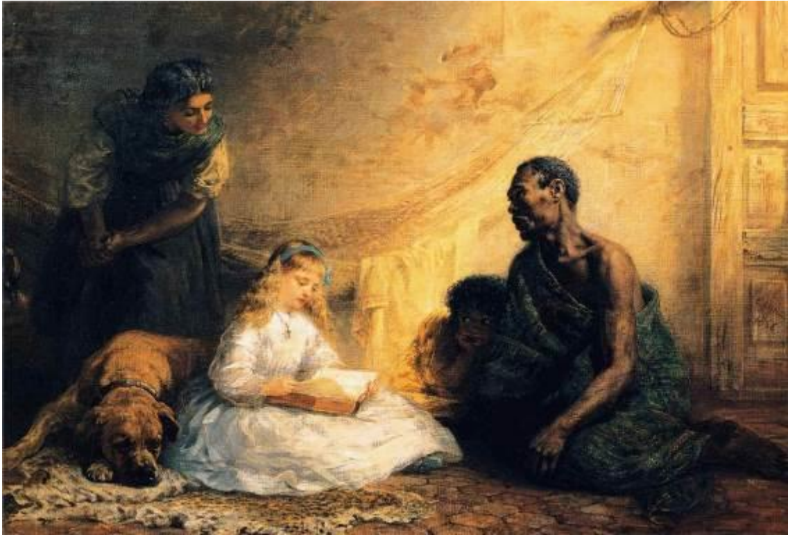
図 1-2 (12 ページ)