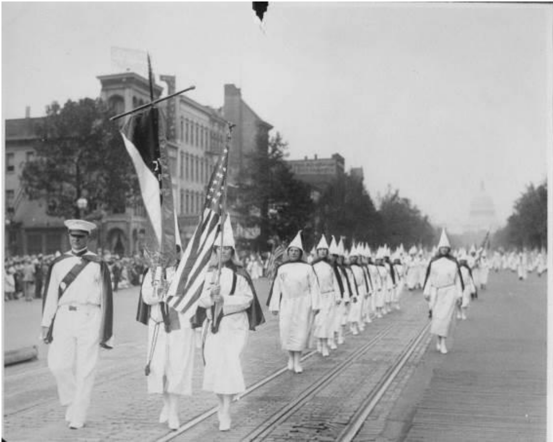
図 2-2 (48 ページ)