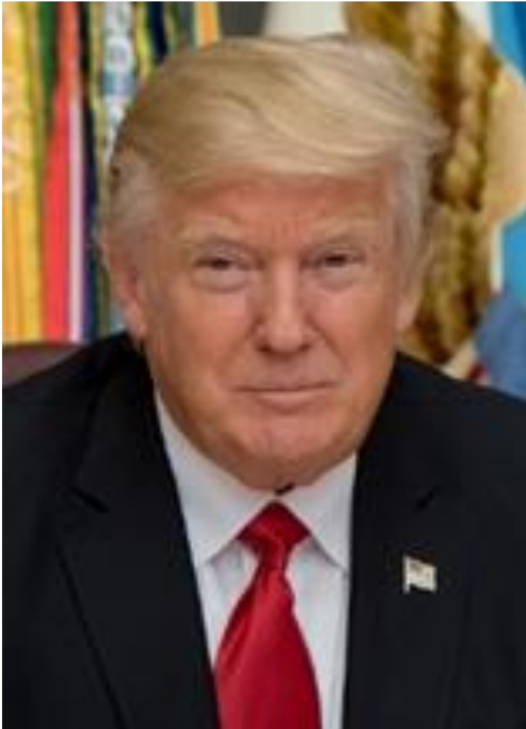
図 2-9 (81 ページ)