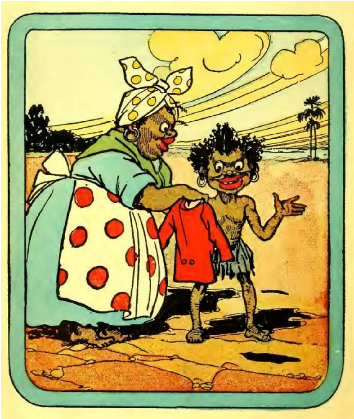
図 1-5 (20 ページ)