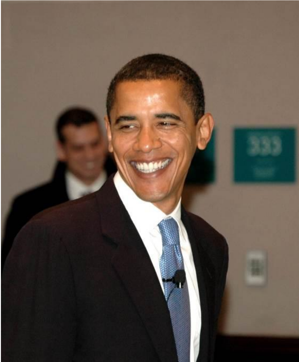
図 2-8 (77 ページ)

<Sen. Barack Obama smiles (微笑むバラク・オバマ上院議員)>