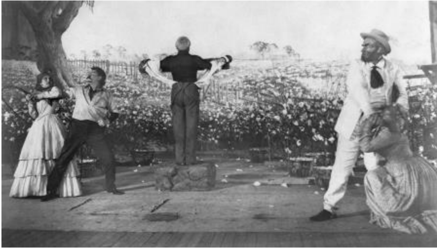
図 1-3 (12 ページ)