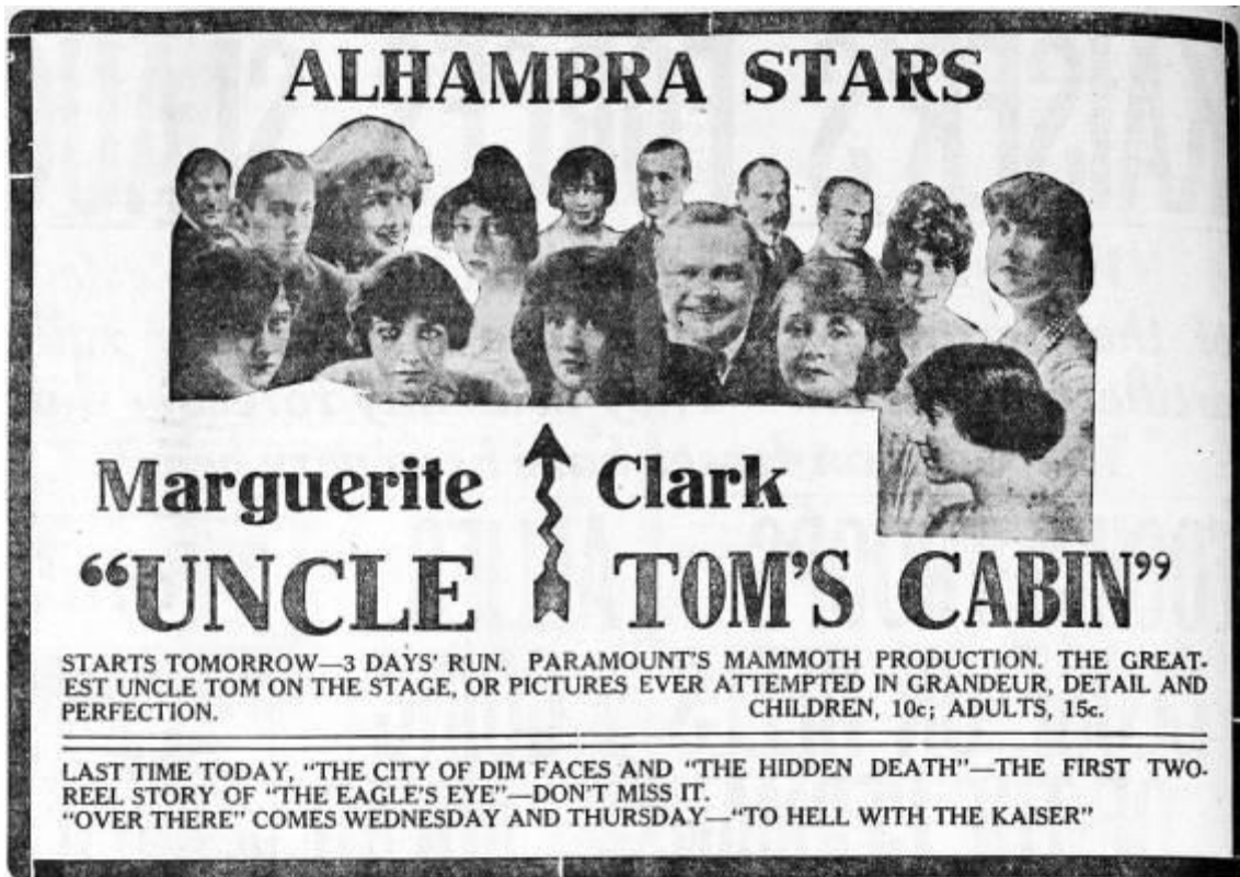
図 1-4 (13 ページ)