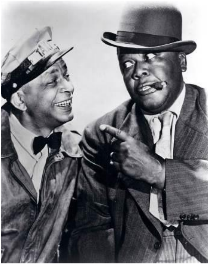
図 2-4 (60 ページ)